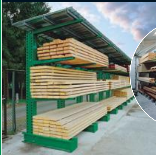
CANTILEVER Zware lasten ■ Charges lourdes