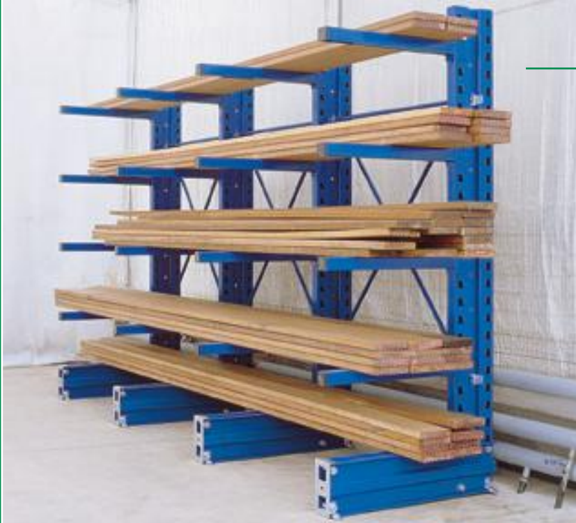
staander enkelzijdig colonne simple-face