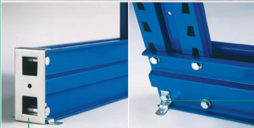
frontplaat basis protection frontale base