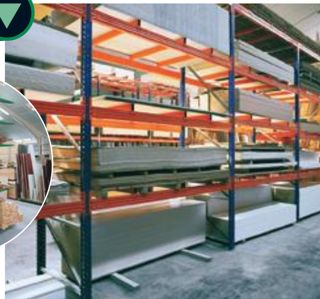
Platenrek ■ Rack à panneaux